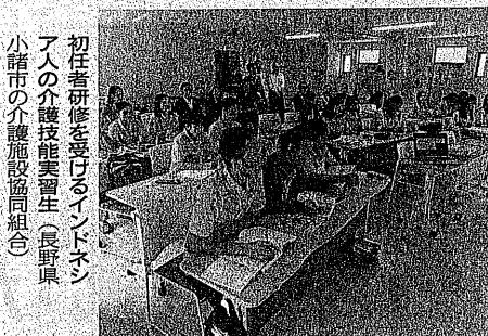
初任者研修を受けるインドネシア人の介護技能実習生(長野県小諸市の介護施設協同組合)

年度までに719人が合資格した。一方、介護福祉士養成の専門学校などに入学した留学生も18年4月には142人と前年比で倍増した。17年9月から介護職での技能実習生も増加が見込まれる。自治体も積極的に動き出した。横浜市は7月、ベトナムのホーチミン市、ダナン市、フエ市や日本語や介護技能の研修を受け入れたい。県内の介護事業者にも声をかけ、甘利氏による説明会を8月に開いた。