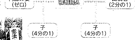
婚外子も嫡出子と同等の相続を受けられるようになり妻らの相続に影響が出る可能性も