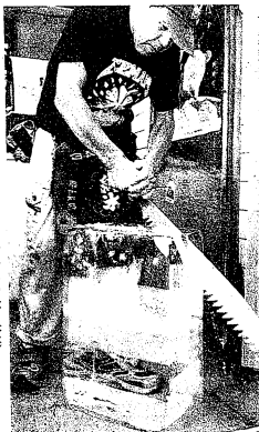
切り分けられる水塊(東京都江東区の岸水室)

をもらう必要があるが、ジップにもつながるよると、補助金や入札で便宜を図るなどの不正が起きかねない。このため個人版のような見返りは禁止している。 に新興国を加えた20カ国・地域(G20)財務相・中央銀行総裁会議は23日午後11時に閉幕する。 日米財務相会談は約30分間の予定で実施し